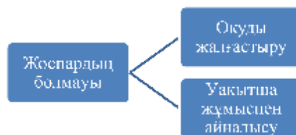
3-сурет – Студенттердің мәңгі студент стратегиясы

деңгейі өте төмен болып табылады. Бұл адамдар еңбек нарығына шығуға дайын болмауымен немесе саналы түрде одан қашақтауларымен сипатталады. Біз бұл стратегия түрінің өкілдерін ақиқатты іздеушілермен салыстыра алмайтындығымызды атау жөн, өйткені олардың бойында даму мен тұлғалық өсуге деген ұмтылыс жоқ. Бұл адамдарды келешекте білім алуға деген ерекше қызығушылығы жоқ, алайда әлі де жұмыс жасауға дайын емес «мәңгі студенттер» ретінде анықтауға болады.