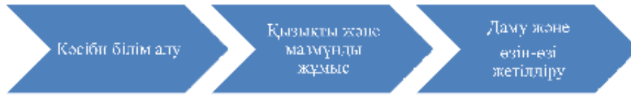
1-сурет – Студенттердің кәсіби өзін-өзі дамыту стратегиясы

қазіргі күннен бастап пайдалы таныстар мен байланыстарды табуға инвестициялар жұмсау үстінде. Қойылған мақсатқа жетудің негізгі әдісі – жақсы диплом және (немесе) білім алуды жалғастыру арқылы бағытталған даму.