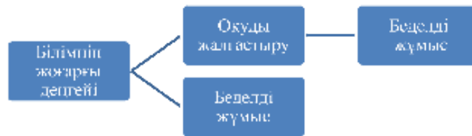
2-сурет – Студенттердің бағытталған даму стратегиясы

Екінші стратегияға сәйкес, білім алушылар үшін беделді және жақсы төленетін жұмысқа орналасу үшін жоғары деңгейдегі білімді алу маңызды. Дипломды алғаннан кейін олар беделді жұмысқа тұрады немесе жемісті мансап үшін магистратураға немесе докторантураға түседі.