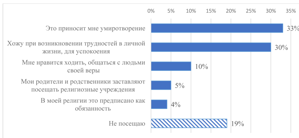
Рисунок 2 – Распределение ответов на вопрос «С какой целью Вы посещаете церковь?», n=112

лужения в храме, около 80% православных хоть иногда, но соблюдают данную практику. С целью определить побуждения для данной практики респондентам был задан соответствующий вопрос – «С какой целью Вы посещаете церковь?». Результаты анализа ответов представлены на рисунке 2. Данные свидетельствуют, что большинство православных ходят в церковь для психологической, эмоциональной поддержки, здесь они находят умиротворение и успокоение.