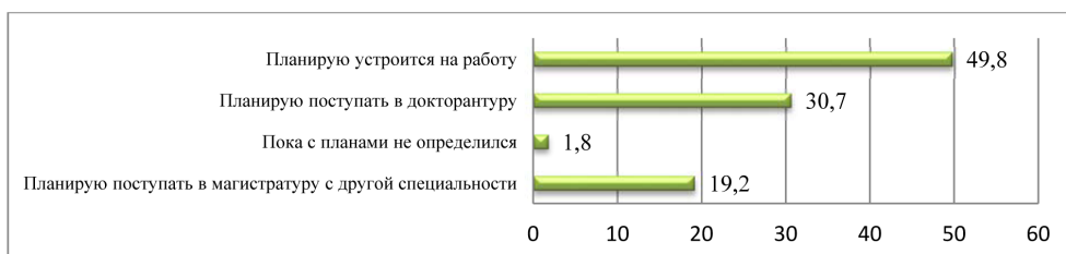
Рисунок 5 – Продолжение образовательной стратегии после магистратуры