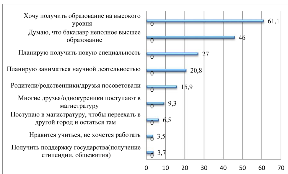
Рисунок 4 – Мотив поступления студентов бакалавриата в магистратуру

Самый важный вопрос исследования при поступлении бакалавров в магистратуру связан с мотивом. Опираясь на результаты исследования, выявлено, самый важный мотив поступления в магистратуру – получение образования на высшем уровне. Студенты считают, что уровень образования бакалавриата является неполным, отсюда выходит такой высокий показатель.