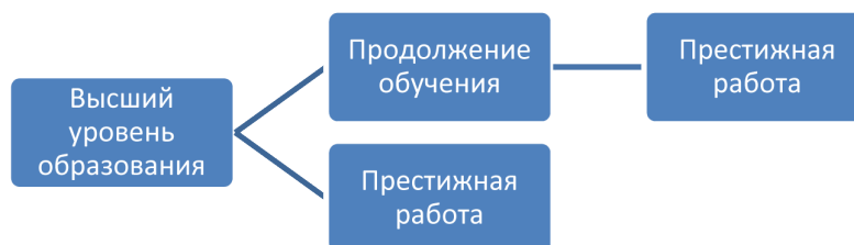
Рисунок 2 – Направленное развитие

лучить высокий статус. Пока что они не готовы выйти на постоянную работу, но уже с этих дней тратят инвестиции на нахождение полезных знакомых и связей. Главный метод достижения поставленной цели – хороший диплом и (или) направленное развитие путем продолжения получения образования (см. рисунок 2).