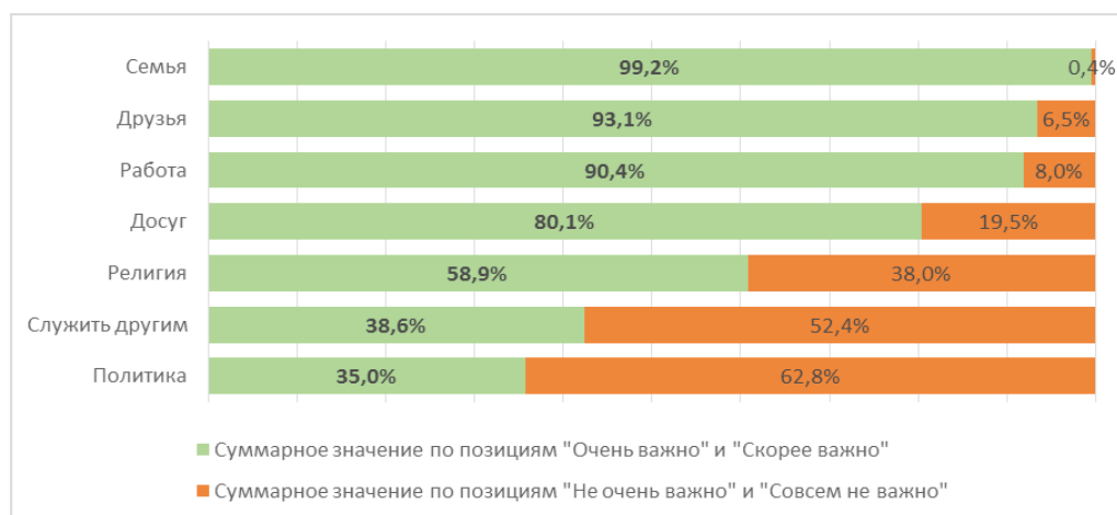
Рисунок 1 – Ранжирование объектов ценностного отношения, N = 1000

– В разрезе национальностей можно отметить, что среди русских респондентов важность религии значительно ниже – 11,8%. Для сравнения религия очень важна для 23,30% казахов и для 18,7% представителей других этносов. При этом вариант «религия скорее важна» выбрали в целом 39,2%, и различия по группам национальностей здесь менее выражены: 41,1% – казахи, 35,8% – русские, 36,3% – другие этносы.