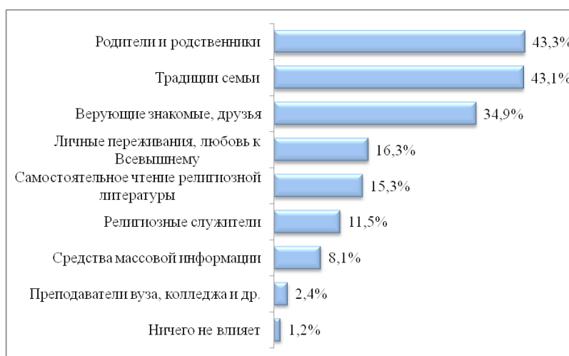
Рисунок 4 – Основные факторы, формирующие религиозное сознание жителей города Алматы

первичной социализации личности являются близкие из социального окружения, оказывающие на нее непосредственное воздействие: родители, семья, родственники, друзья, одноклассники, учителя. Проведенное исследование подтвердило, что наиболее распространёнными факторами, формирующими религиозное сознание жителей Алматы, являются родители, родственники, либо традиции семьи в целом. С целью определить это, т.е. что формирует религиозное сознание алматинцев, участникам опроса задавался соответствующий вопрос: «Какие основные факторы влияют на формирование вашего религиозного сознания?». Результаты ответов на данный вопрос представлены на рисунке 4, в порядке убывания распространённости факторов. Данный вопрос был проанализирован в разрезе статуса семей – в результате статистически значимых различий не наблюдается.