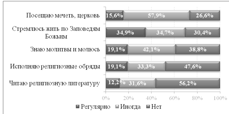
Рисунок 2 – Распределение ответов на вопрос «Скажите, пожалуйста, насколько Вы активны в религиозной деятельности?»

ответов «нет, не выполняю». Исследование свидетельствует, что для большинства алматинцев, религиозная активность проявляется в посещении мечети/церкви и стремлении жить по Заповедям Божиим. Неоднозначна практика в отношении чтения религиозной литературы: немногим более половины горожан не читают её вообще, значительная часть (31,6%) читает иногда и 12,2% читают регулярно.