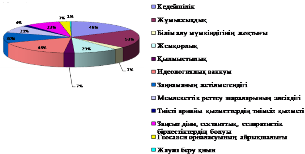
1-сурет – Қазақстан аумағында діни ахуалдың күрделенуіне себеп болатын жағдайлардың көрсеткіші

«Сіздің ойыңызша, Қазақстан аумағында діни ахуалдың күрделенуіне қандай жағдайлар ең көп дәрежеде себепші болады?» деген сауал қойылды (1-сурет).