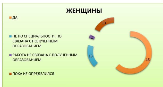
Рисунок 2 (лист 2) – Планы студентов на будущее

На вопрос «Что, по Вашему мнению, обеспечивает успех в профессиональной деятельности?» мужчины определили 2 оптимальных варианта. Первый «высокий профессионализм» и «упорный труд». В нижней границе выбора стоят такие варианты, как «творческий потенциал» и «связи».