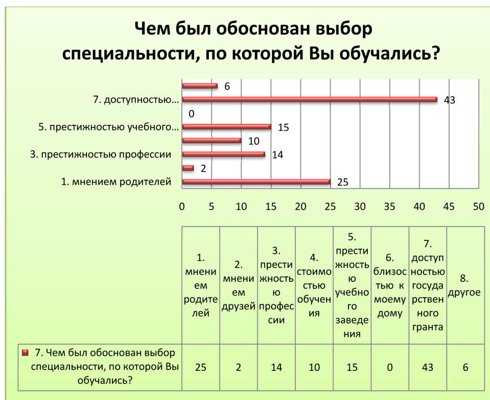
Рисунок 1 – Выбор студента

нитарных наук 16 респондентов – мужчины и 71 респондент является представительницами женского пола. Рост уровня образования женщин привел к увеличению их численности в науке. Данные показатели доказывают, что гуманитарные науки постепенно стали «женскими».