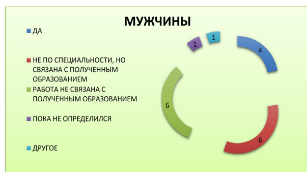
Рисунок 2 (лист 1) – Планы студентов на будущее

К проблеме трудоустройства мужчины подошли стандартно, 8 респондентов решили довериться на родителей или друзей. 2 респондента решили самостоятельно решить данную проблему, обратившись в службу занятости. Женщины не стали искать оригинальных путей решения данной проблемы, 27 респондентов выбрали вариант «рассчитываю на родителей или друзей».