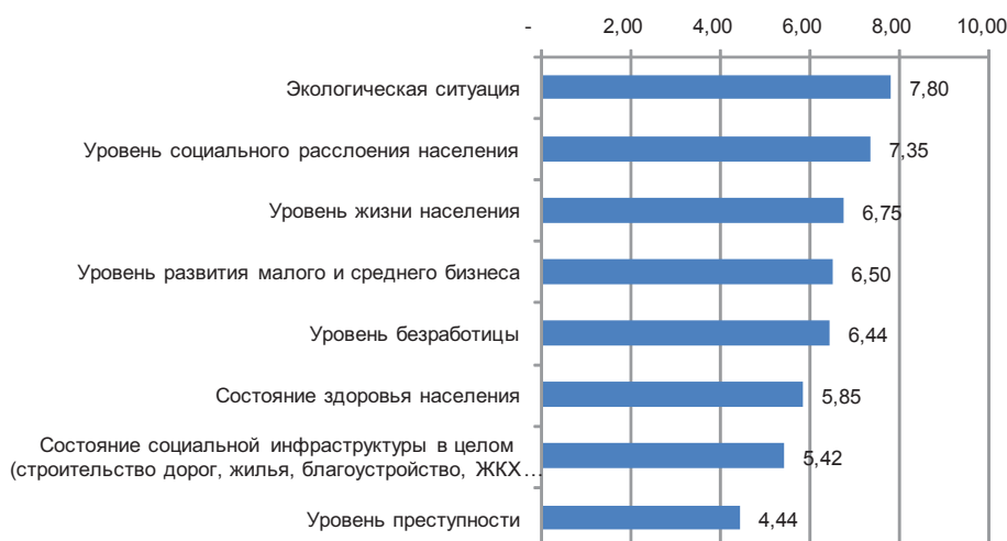
Диаграмма – «Как Вы оцениваете СТЕПЕНЬ влияния нефтегазовой отрасли на следующие сферы социально-экономической жизни области?» Для оценки используйте 10-балльную шкалу, где 0 – отсутствие влияния, 10 – абсолютная степень влияния

По оценкам экспертов, наименее слабо выражена связь между нефтегазовой промышленностью и уровнем преступностью в регионе (4,44).