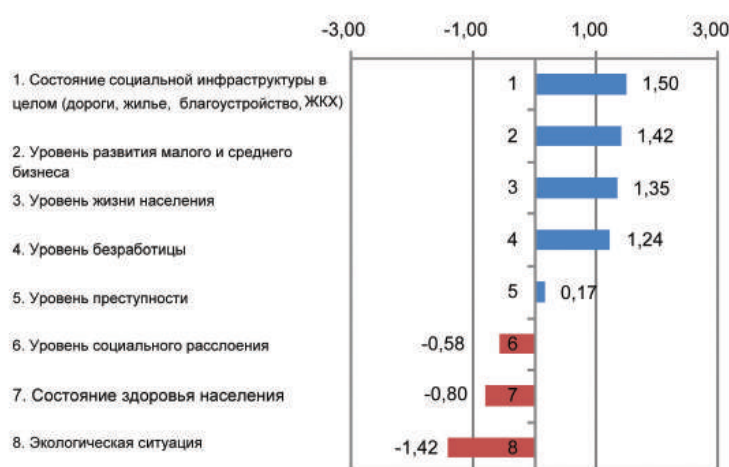
Диаграмма – «Как Вы оцениваете характер влияния нефтегазовой отрасли на следующие сферы социально-экономической жизни области?» Для оценки используйте шкалу от -3 до 3, где -3 – крайне отрицательное влияние, 3 – абсолютно положительное влияние, 0 – неоднозначное влияние

Негативное влияние нефтегазовой промышленности, как и следовало ожидать, связано с уровнем социального расслоения, состоянием здоровья населения и экологической ситуацией.