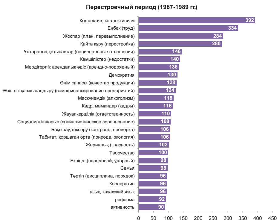
Диаграмма №6 – Рейтинг частоты упоминаемости слов, понятий в прессе (в абсолютных числах)

«Перестройка направлена на укрепление социальной инициативы, поднимает актуальные социальные и экологические проблемы, и это правильно. Но есть и другие инициативы так называемых национально-патриотических клубов, движений, например в Ленинграде «Память», основной лозунг которых борьба против тех, кто скрывает свою этническую принадлежность, и такие явления тоже имеют места в нашем обществе» [17, с.3].