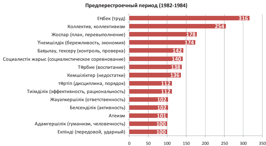
Диаграмма №3 – Рейтинг частоты упоминания слов, понятий в прессе (в абсолютных числах)

«В 1982 году мы должны не только выполнить, а перевыполнить. При использовании ресурсов необходимо обеспечить порядок строгой экономии, бережливости» [4. с.1] (КПСС. Ноябрь. Выступление на пленуме Л.И.Брежнева, №59, 26.03.1982, Еңбек туы)