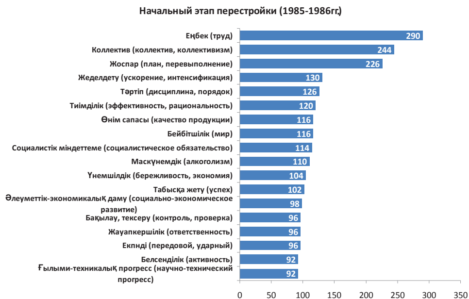
Диаграмма №5 – Рейтинг частоты упоминаемости слов, понятий в прессе (в абсолютных числах)

«В концепции ускорения самое главное – это увеличение темпа роста экономики. Но основной смысл заключается в новом качественном росте, в развитии научно-технического прогресса, структурной перестройке экономики, использовании эффективных форм управления в организации труда и стимулировании. В русле ускорения необходимо проводить социальную политику и укрепление социальной справедливости» [10, с.1].