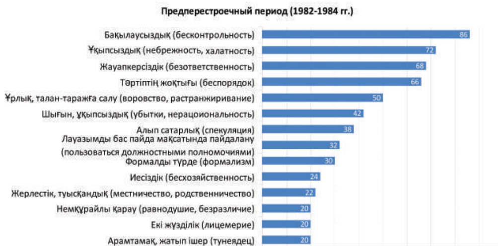
Диаграмма №4 – Рейтинг частоты упоминания слов, понятий в прессе (в абсолютных числах)

«Из-за ослабления контроля и ряда других причин развивается собственничество, растратничество государственного имущества, получение зарплаты без труда, тунеядство. Особенно данные явления имеют место в таких сферах, как: торговля, общественное питание, обслуживание населения, медицина, частные лица, сдающие квартиры в курортных местах» [8, с.4].