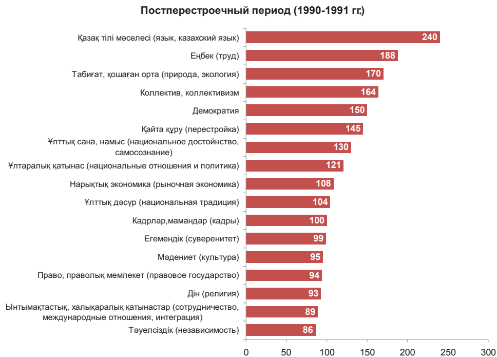
Диаграмма №7 – Рейтинг частоты упоминания слов, понятий в прессе (в абсолютных числах)

В прессе самым обсуждаемыми темами были 28 съезд ЦК КПСС (1990 г.) и принятие в октябре 1990 года декларации «О независимости КазССР».