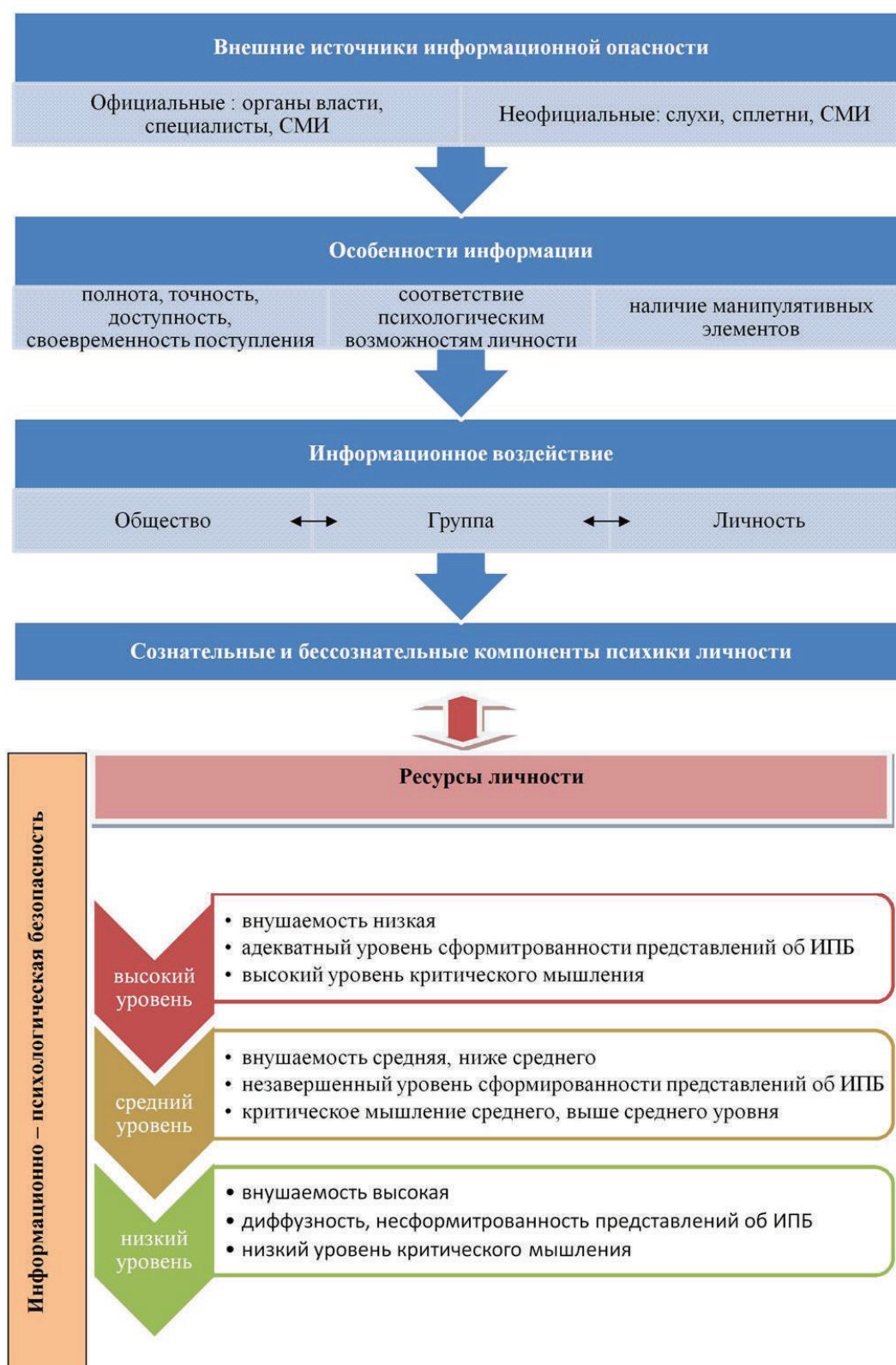
Рисунок 2 – Уровневая модель информационно-психологической безопасности личности