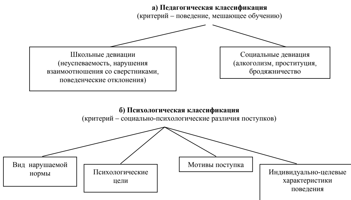
Рисунок 1 – а, б – Психолого-педагогическая классификация девиантного поведения

Обобщая определения данные учеными из разных областей знаний, А.Т. Акажанова предлагает свое видение понятия «девиантного поведения» несовершеннолетних: «Девиантное поведение – это отклонение от социокультурных норм и традиций, принятых этносоциумом, связанное с внутриличностным и межличностным конфликтом, приводящее несовершеннолетнего