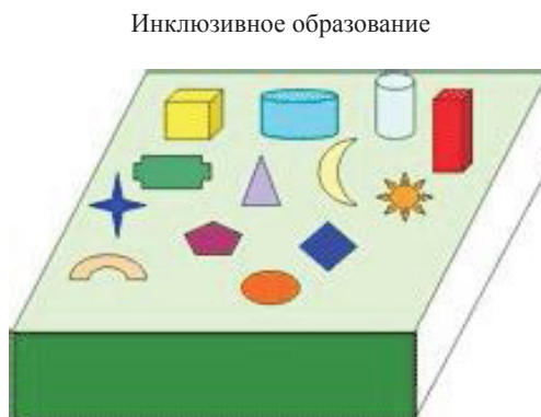
Рисунок 2 – Схема интегрированного и инклюзивного образования

зование с помощью реабилитации и адаптации подстраивает специального ребенка к обычному образованию. И наконец, инклюзивное образование, воспринимая ребенка таким, какой он есть, подстраивает под него систему образования.