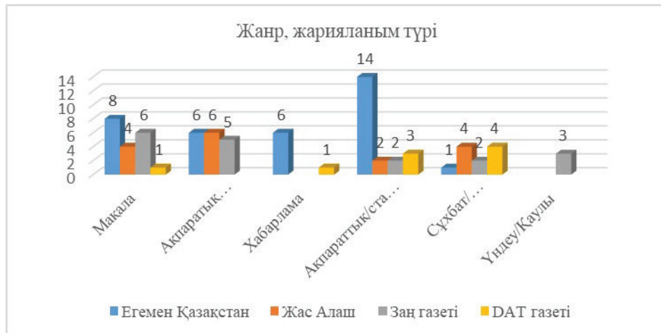
2-сурет – Мақаланың жанры, жарияланым түрі

Зерттеу жүргізген мерзімді басылымдардағы дәстүрлі мақала және ақпараттық хабарламалар кең жарияланады. Жарияланған дәстүрлі мақала – 23,7, ал ақпараттық мақала – 21,2, ақпараттық, статистикалық жаңалықтар хабарламасы – 26,5, жаңалықтар хабарламасы – 8,7. Деректердің сандық көрсеткіші 2-диаграммада берілген. Берілген деректер нәтижесінен байқағанымыздай Қаңтар оқиғасы барысын хабарлайтын мақалалар жанрына талдау нәтижесі бойынша ақпараттық, статистикалық жаңалықтар хабарламасының көп жарияланғаны байқалады, ал ең аз жарияланған жанр сұхбат және үндеу жанры болды. Жас Алаш газетінің жанрлық ерекшелігіне байланысты дәстүрлі мақаланың пайыздық үлесінен оның жиі жарияланатынын байқауға болады (Аверьянов, 2009).