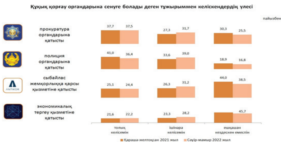
3-сурет – Тұрғындардың құқық қорғау органдарына сенімі деңгейі

Елімізде құқық қорғау органдары мен тұрғындардың қарым-қатынасы деңгейі, үдерісі Ұлттық статистика бюросы тарапынан жылына екі рет жүргізіліп отырады. Келесі диаграммдан (3-сурет) халықтың құқық қорғау органдары мен сот жүйесіне деген сенім деңгейі бойынша кезекті іріктеу арқылы жүргізілген зерттеу деректерін көруге болады.