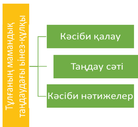
2-сурет – Дж.Холланд бойынша мамандық таңдаудағы тұлғаның мінез-құлқының үлгісі

*Ескерту: дереккөз бойынша мақала авторлары құрастырған (Brunello, Fort, Guglielmo Weber, Christoph, 2013)