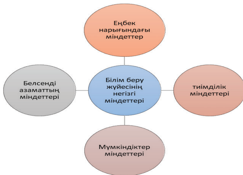
1-сурет – Герман ван де Верфхорст бойынша білім беру жүйесінің негізгі міндеттері

*Ескерту: дереккөз бойынша мақала авторлары құрастырған (Brunello, Fort, Guglielmo Weber, Christoph, 2013)