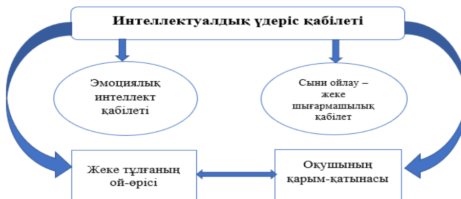
2-сурет – Интеллектуалдық үдеріс қатынасы

Сондықтан психологтар оқу үдерісінде оқушылардың сыни ойлау арқылы эмоциялық интеллектін жетілдіруде оның ізденушілік, зерттеушілік қызметі арқылы шығармашылық ойлауының дамуына ықпалы жоғары болатындығын көрсетеді. Сыни ойлауға эмоциялық интеллектінің қатынасын 2-суретте көруге болады.