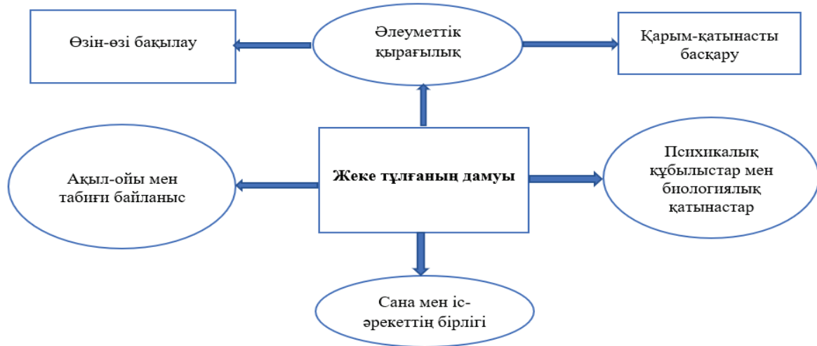
1-сурет – Жеке тұлғаның психикалық даму әрекеті

терді, әдістерді ашып көрсету қажеттілігі туындап, оны жан-жақты қарастыру негізге алынды. Ол 1-сурет арқылы сипатталды.