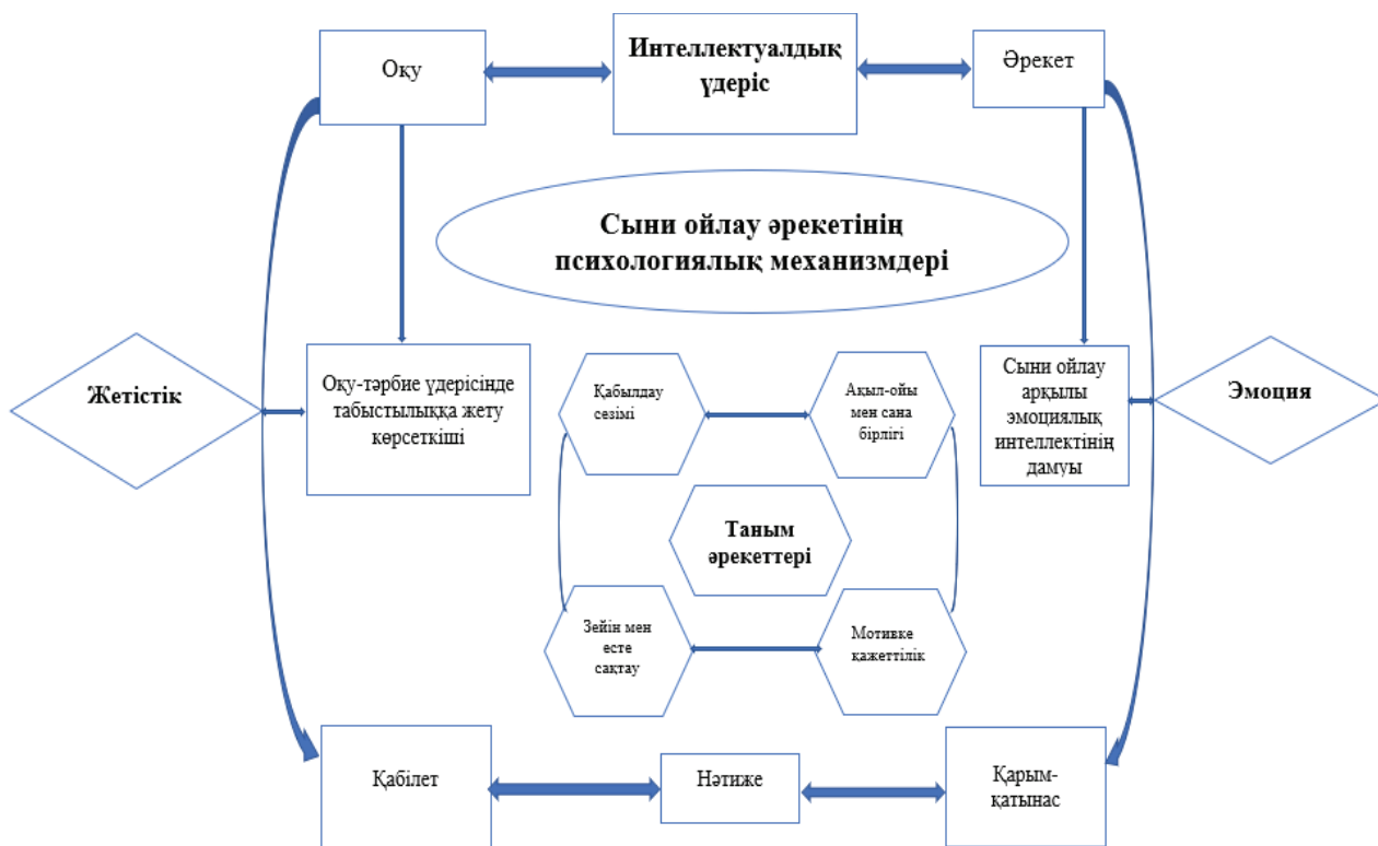
3-сурет – Сыни ойлаудың психологиялық механизмдері

жүйесінде оқушының оқу, интеллектуалдық үдерісін реттеу, әрекетін пайымдау үшін оның жетістікке жетудегі оқу-тәрбие үдерісінің нәтижесі, таным әрекеттері (ойлау, мотивация, есте сақтау, қабылдау) арқылы нәтижеге жету, қарым-қатынас орнату негізінде эмоциясын реттеуге бағыт-бағдар береді. Оны 3-сурет арқылы бердік.