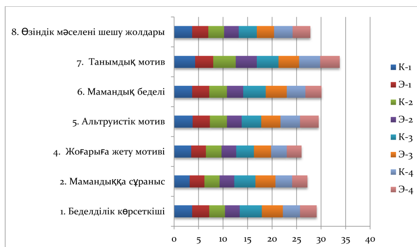
3-сурет – Мектеп мұғалімі, мамандық таңдау мотиві бойынша орташа мәндер (педагогикалық мамандықтың 3-курс студенттері)

Әр мамандық бойынша мотивациялық профиль 3-суретте көрсетілген.