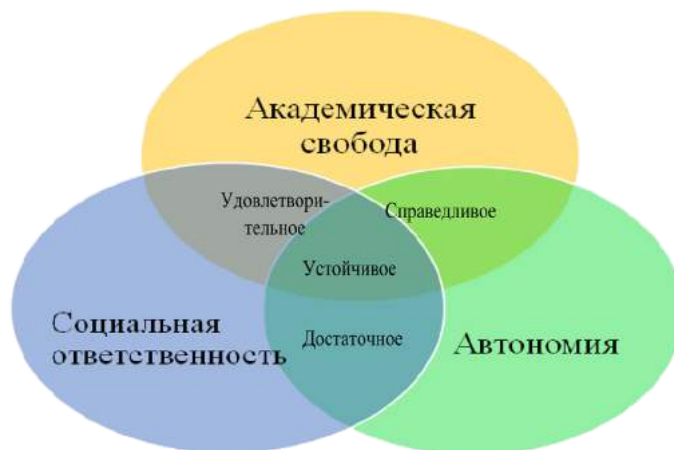
Рисунок 3 – Взаимосвязь основных трендов для устойчивого развития вузов

Когда в вузе расширены академические свободы и предоставлена финансовая и управленческая автономия, но развитие социальной ответственности вуза невысокое, то развитие самого вуза можно охарактеризовать как «справедливое». Т.е. административные, стратегические и финансовые ресурсы вуза направлены на развитие академических свобод и повышение качества образования.