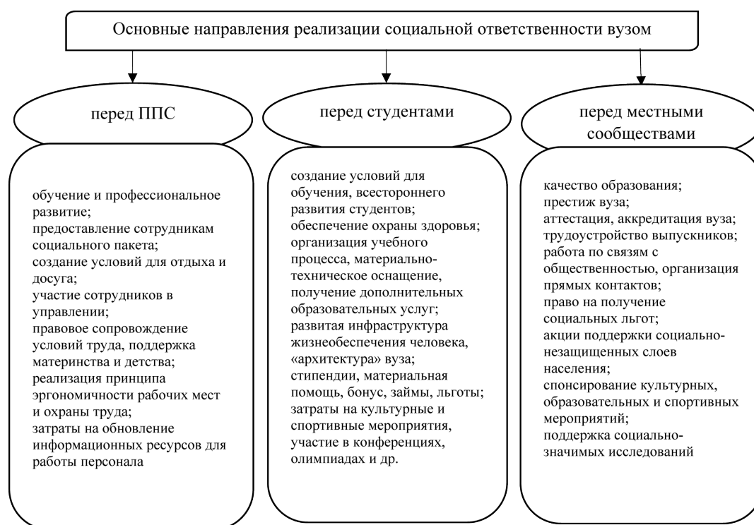
Рисунок 1 – Матрица основных направлений реализации социальной ответственности вузом

Как правило, функционирование вуза как социального института проявляется в «организационном поведении» на трех уровнях: индивидуального поведения сотрудников; коллективного поведения формальных и неформальных групп в рамках вуза; стратегии поведения вуза в обществе. На рисунке 1 нами выделены основные направления реализации социальной ответственности вузом.