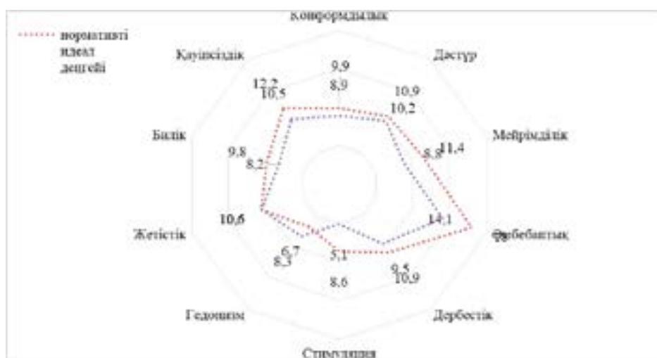
3-сурет – Мәдени құндылық бағдарларды (SVS – Schwartz Value Survey) өлшеу әдістемесі бойынша студент жастардың нормативті идеалдары мен жеке басымдықтары арасындағы айырмашылықтар

көлеміне түзетілген сенімдер (идеалдар) мен әрекеттер (басымдықтар) деңгейінің арасындағы каноникалық корреляция коэффициентінің шамасы + 0,987-ге тең ( RCi = + 0,987, p < 0,000 ). Нәтижелер екі: сенім деңгейі мен басымдықтар деңгейі арасындағы айтарлықтай күшті оң байланыстың (Canonical R > 0,9) болуын анықтауға мүмкіндік береді, бұл өз әрекеттерінде қазіргі студент жастардың өз сенімдерін (идеалдарын) басшылыққа алатынын көрсетеді.