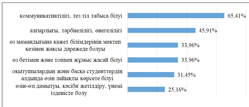
1-сурет – Бірінші курс студенттерінің жоғары оқу орнына бейімделуіне әсер ететін жеке қасиеттері

дәлелдейді. Зерттеу нәтижесінде анықталған тиімді бейімделу әдістерінің әрқайсысын толығырақ қарастырып өтсек.