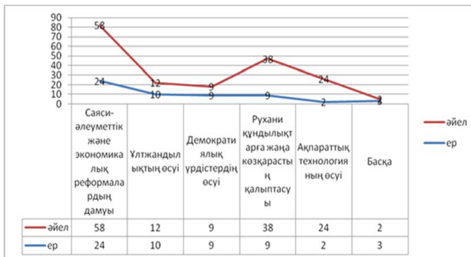
3-сурет – Қазақстанда интеллектуалды ұлттың қалыптасуына әсер ететін факторлар (жыныстық ерекшелік бойынша салыстыру)

Жыныстық ерекшелік бойынша талдауда байқағанымыздай ерлерге (2) карағанда әйелдер (24) ақпараттық технологияның өсуін басты факторлардың бірі деп қарайды (3-сурет).